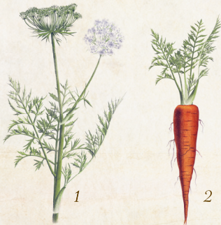
1 Möhrenblüte 2 Möhrenpflanze

Seit Mitte der 1980er Jahre zunehmend Hybride die samenfesten Sorten verdrängten, wächst auch das Engagement unabhängiger SaatgutforscherInnen für deren Weiterentwicklung, denn die alten Sorten sind ein bunter Gen-Pool, aus dem durch Auslese und Kombination immer wieder neue Sorten entstehen können. Da das mit sterilen CMS-Hybriden überhaupt nicht möglich ist, geht es angesichts existentieller Veränderungen, wie beispielsweise dem Klimawandel, hierbei keineswegs um Nostalgie, sondern um unsere Ernährung in der Zukunft: Nur mit Biodiversität können LandwirtInnen den regionalen oder stark schwankenden Standortbesonderheiten erfolgreich begegnen und den Ernährungsbedürfnissen der Menschen gerecht werden.