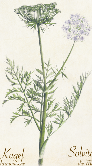
Solvita die Milde