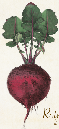
Rote Kugel die Harmonische